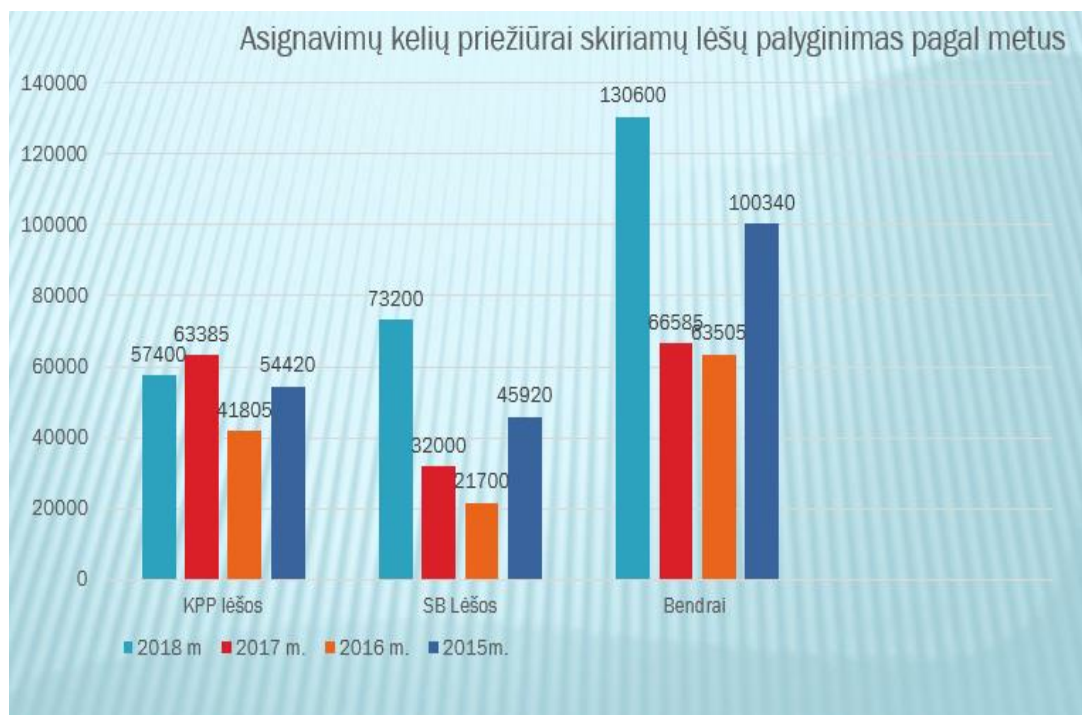
2 pav. asignavimų kelių priežiūrai suvestinė (SB ir KPPP lėšos)

Pagal Klaipėdos rajono savivaldybės tarybos 2017-02-23 sprendimu Nr. T11-72 patvirtintą Klaipėdos rajono savivaldybės vietinės reikšmės kelių sąrašą, Sendvario seniūnijoje inventorizuota 85, 531 km kelių , iš kurių asfalto danga sudaro 16,070 km , o keliai su žvyro dangą sudaro 72,007 km .