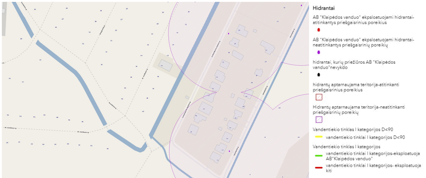
1 pav. Klaipėdos miesto ir rajono hidrantų išdėstymas.