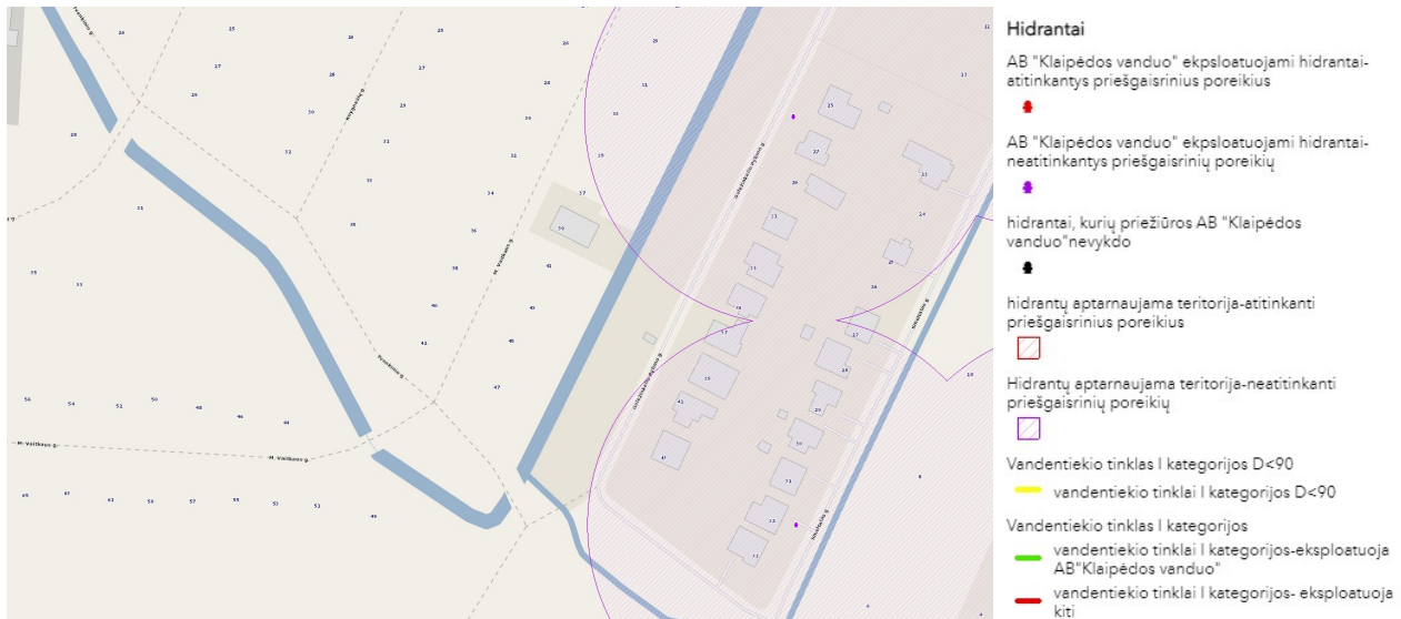
1 pav. Klaipėdos miesto ir rajono hidrantų išdėstymas.