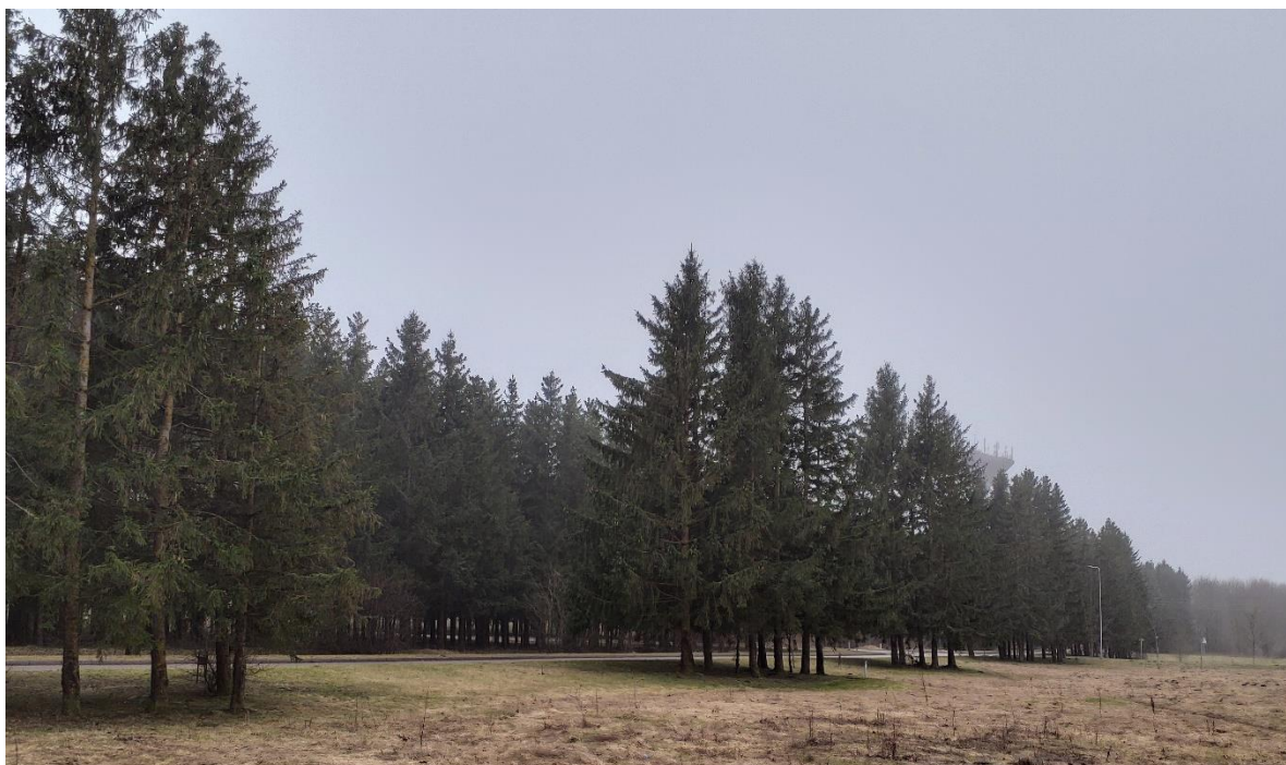
1 pav. Eglių apsauginiai želdiniai

Įvertinti 44 medžiai 45 liemenimis, iš jų projekte numatyta šalinti 40 medžių.