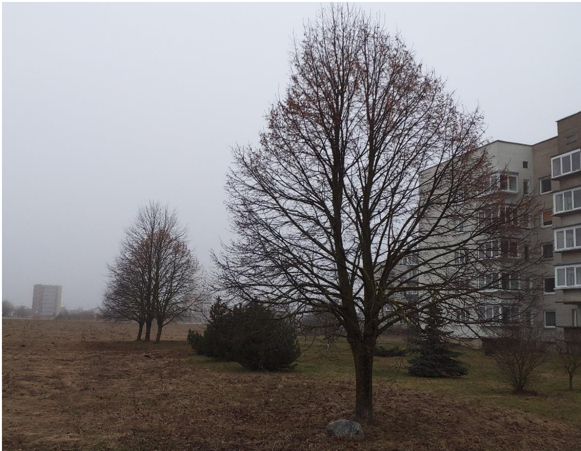
3 pav. Didžialapės liepos