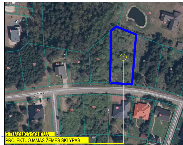
SITUACIJOS SCHEMA PROJEKTUOJAMAS ŽEMĖS SKLYPAS