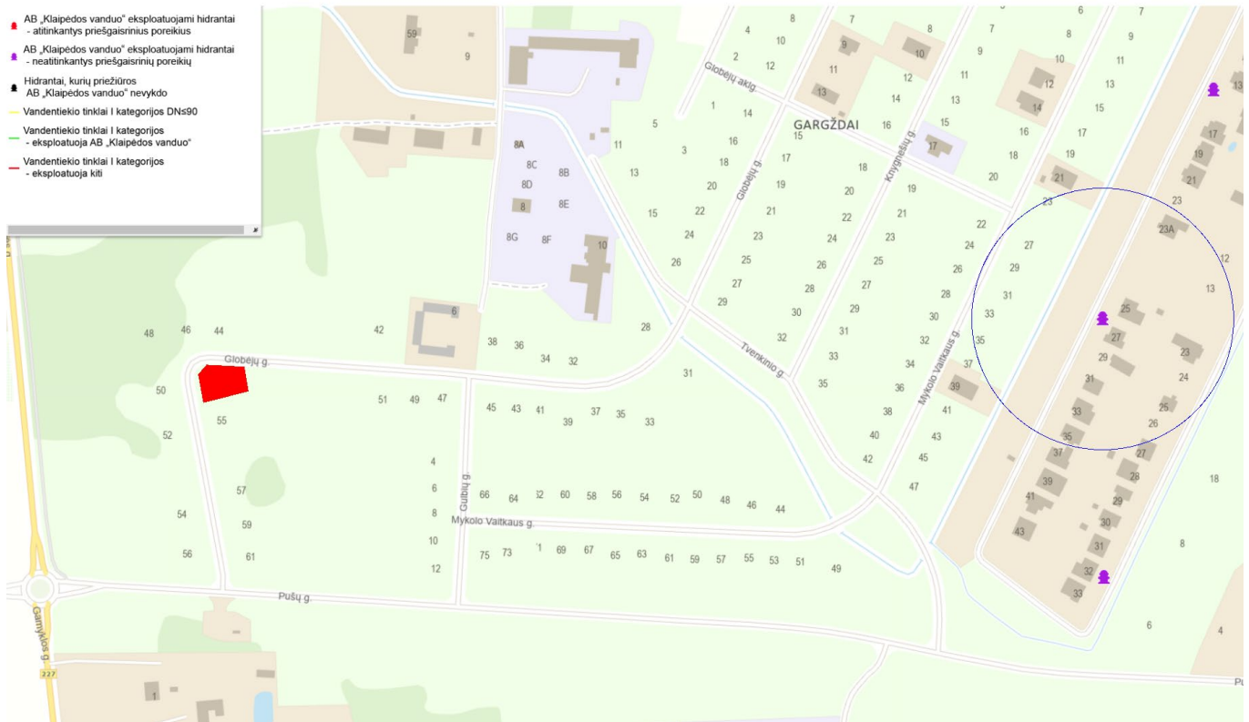
1 pav. Klaipėdos miesto ir rajono hidrantų išdėstymas.