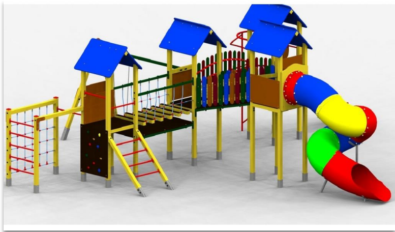
Vaikų žaidimų aikštelė Kretinga.