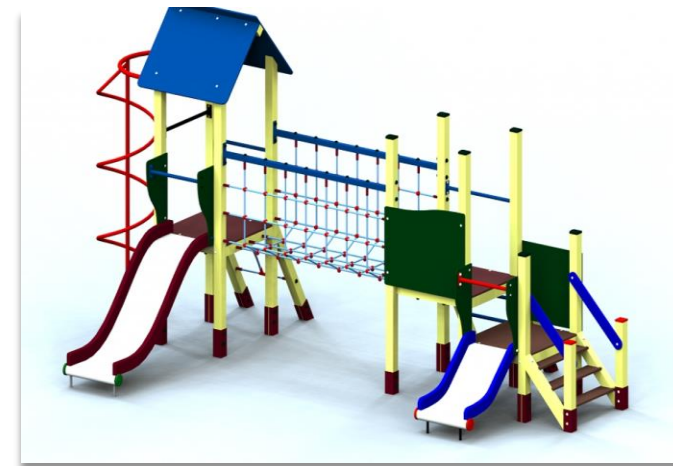
Lauko vaikų žaidimų aikštelė Kelmė.