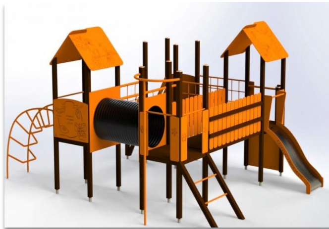
Lauko vaikų žaidimų kompleksas Lokiukas.