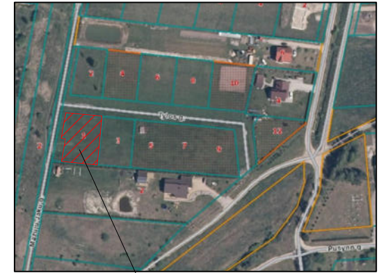
Planuojamas žemės sklypas

IŠTRAUKA IŠ ŽEMĖS SKLYPO KAD. NR. 5544/0003:538 ESANČIO DOVILŲ MIESTELYJE, DOVILŲ SENIŪNIJOJE, KLAIPĖDOS R. SAV., DETALIOJO PLANO