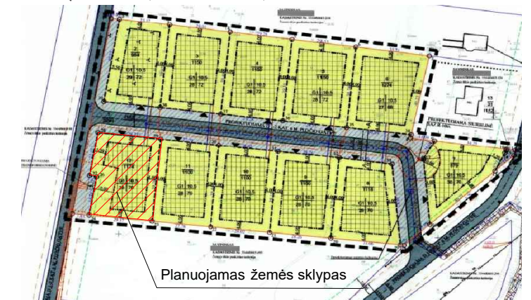
Planuojamas žemės sklypas

IŠTRAUKA IŠ ŽEMĖS SKLYPO KAD. NR. 5544/0003:538 ESANČIO DOVILŲ MIESTELYJE, DOVILŲ SENIŪNIJOJE, KLAIPĖDOS R. SAV., DETALIOJO PLANO