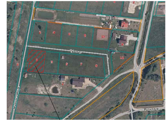
Planuojamas žemės sklypas

IŠTRAUKA IŠ ŽEMĖS SKLYPO KAD. NR. 5544/0003:538 ESANČIO DOVILŲ MIESTELYJE, DOVILŲ SENIŪNIJOJE, KLAIPĖDOS R. SAV., DETALIOJO PLANO