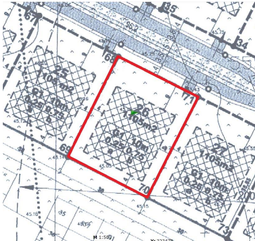
Ištrauka iš pagrindinio brėžinio