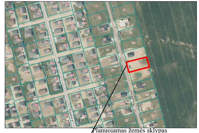
Planuojamas žemės sklypas