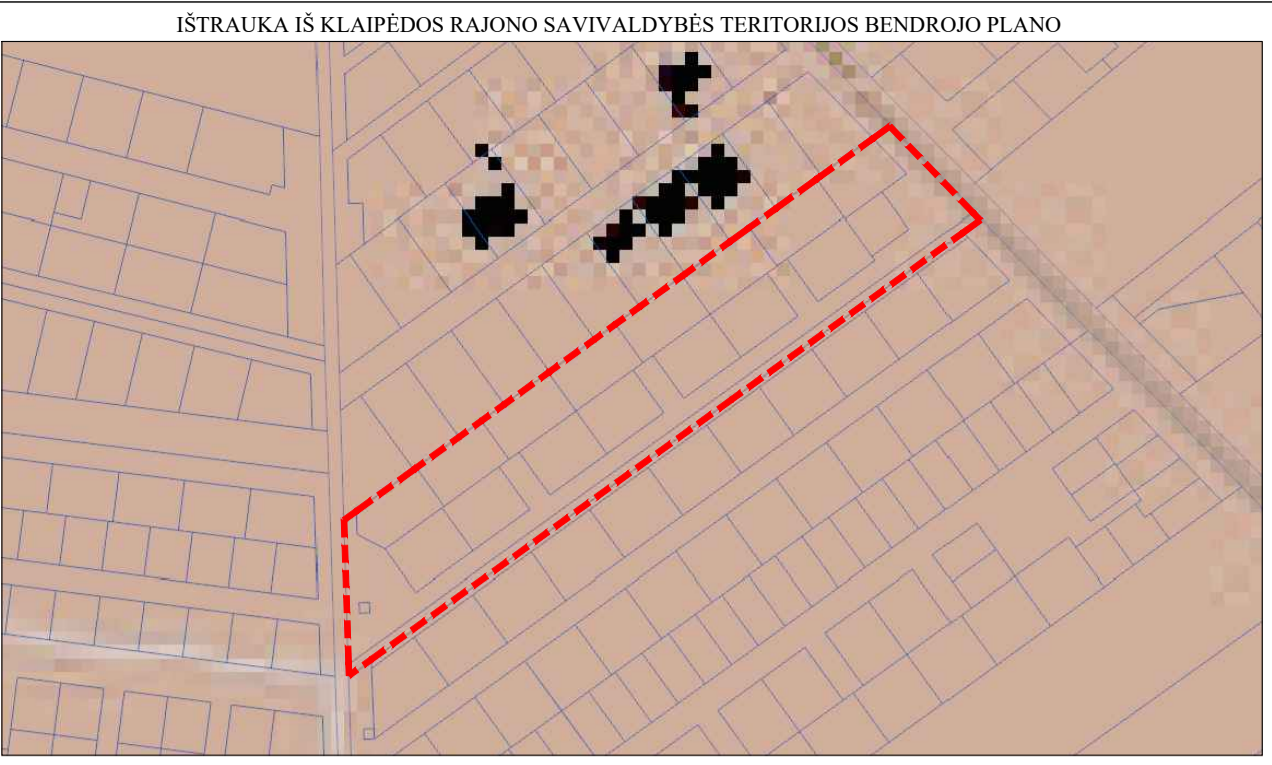
PLANUOJAMOS TERITORIJOS RIBA