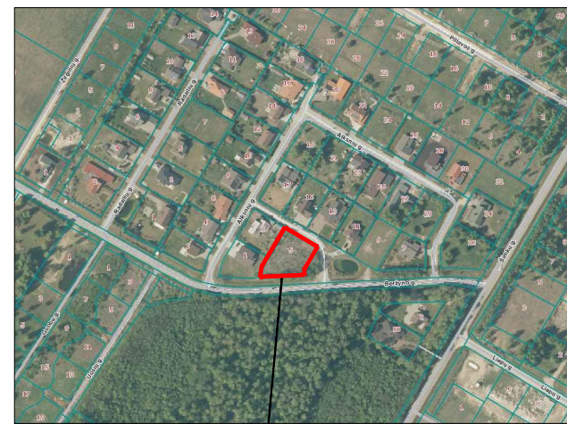
Planuojamas žemės sklypas