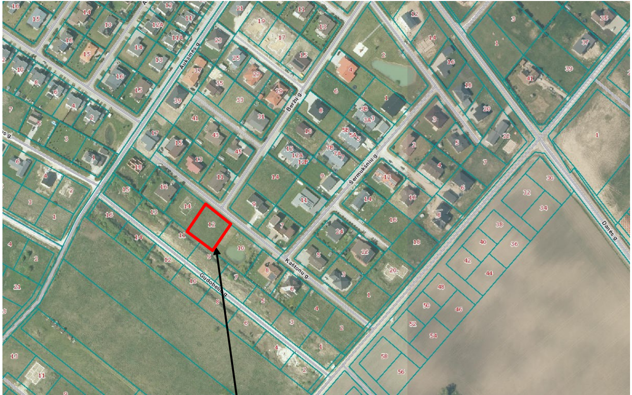
Planuojamas žemės sklypas Kaštonų g. 12, Trušelių k., Klaipėdos raj.

1.1. Detaliojo plano iniciatorius. Duomenys nuasmeninti.