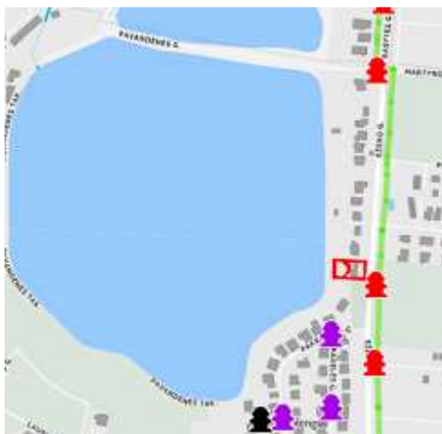
1. Hidrantų išdėstymo vietų a schema.

Vanduo išorės gaisrų gesinimui. Greta planuojamų žemės sklypų įrengtas priešgaisrinis hidrantas.