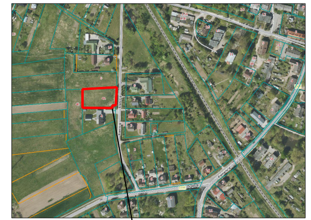
Planuojamas žemės sklypas