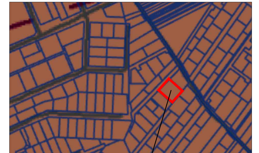
Vadovaujantis Klaipėdos rajono bendrojo plano sprendimais, planuojama teritorija patenka į vidutinio užstatymo intensyvumo zoną Nr. 184, kur pagrindinė žemės naudojimo paskirtis - kita, galimi žemės naudojimo būdai: G2, G1, K, V, R, B, I2, E.