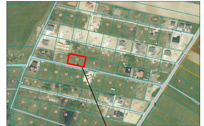
Planuojamas žemės sklypas