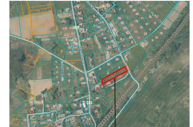
Planuojama teritorija Žemės sklypas Kalotės k., Kretingalės sen., Klaipėdos raj. (kad. Nr. 5528/0001:646).