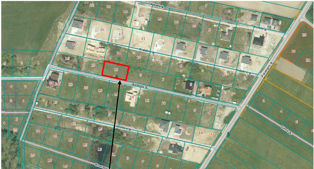
Planuojamas žemės sklypas Andulių g. 11, Girkalių k., Klaipėdos raj.

1.1. Detaliojo plano iniciatorius. Fizinis asmuo (duomenys nuasmeninti).