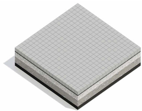
Monochrominės trinkelės – visiems pėsčiųjų takams naudojama tamsesnė tautinio rašto trinkelė.