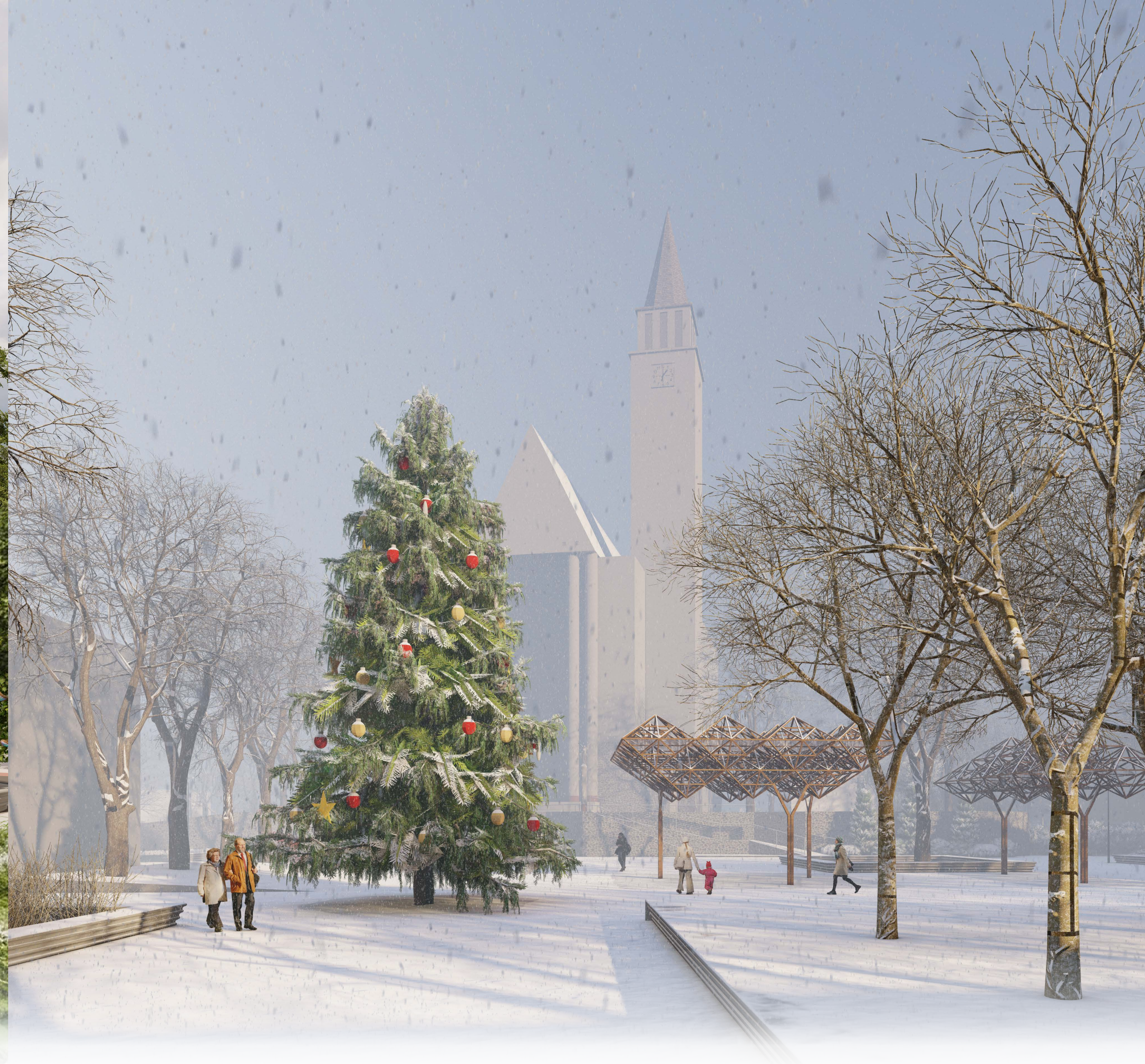
Rinkos aikštės vaizdas šiaurės rytų kryptimi