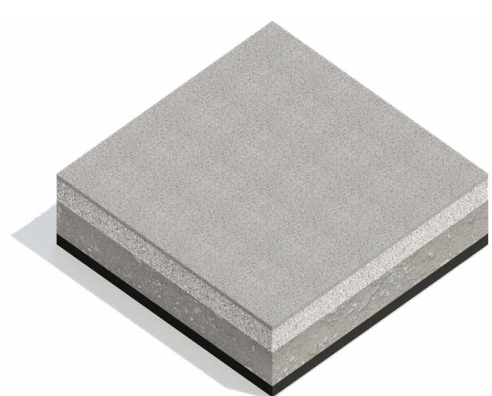
Alsių dangą – naudojama pasiviro tako ir dangos po suolais įrengimui.