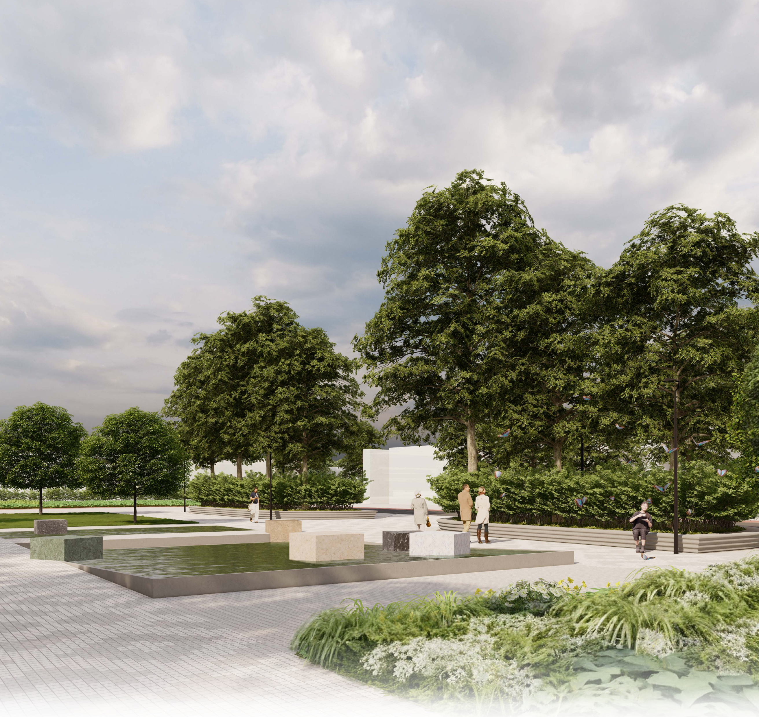
Savivaldybės aikštės vaizdas pietvakarių kryptimi