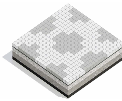
Tautinio rašto trinkelės – vidutiniškai ir šviesiai pilkos betoninės trinkelės sudaro ornamentinį raštą.