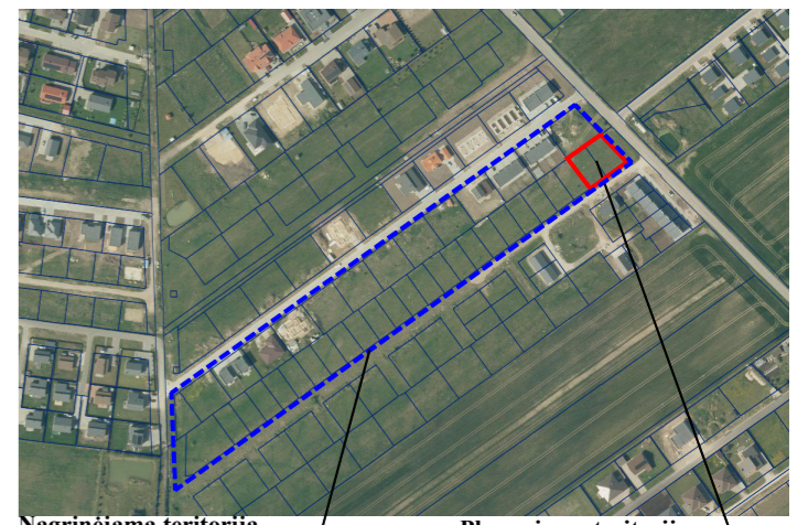
Nagrinėjama teritorija (teritorija tarp Silininkų g., Agilos g., Luknojų g., Gilijos g.) Planuojama teritorija (žemės sklypai Luknojų g. 1 ir 1A, Trušelių k., Sendvario sen., Klaipėdos raj.)