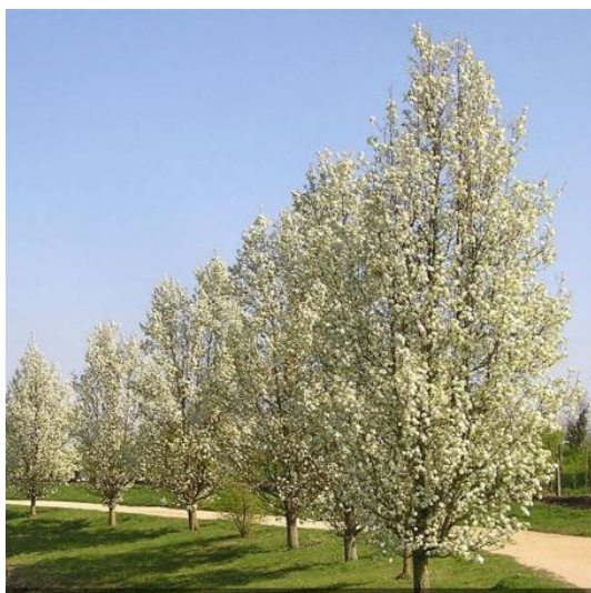
Plačialapė kriaušė 'Chanticleer'

2. Alėją formuojantys siauros lajos lapuočiai medžiai. Siūlomas asortimentas: