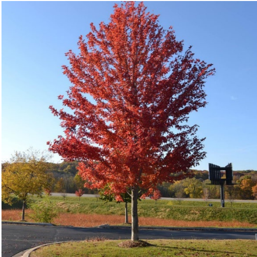
Sidabruotasis klevas 'Autumn Blaze'