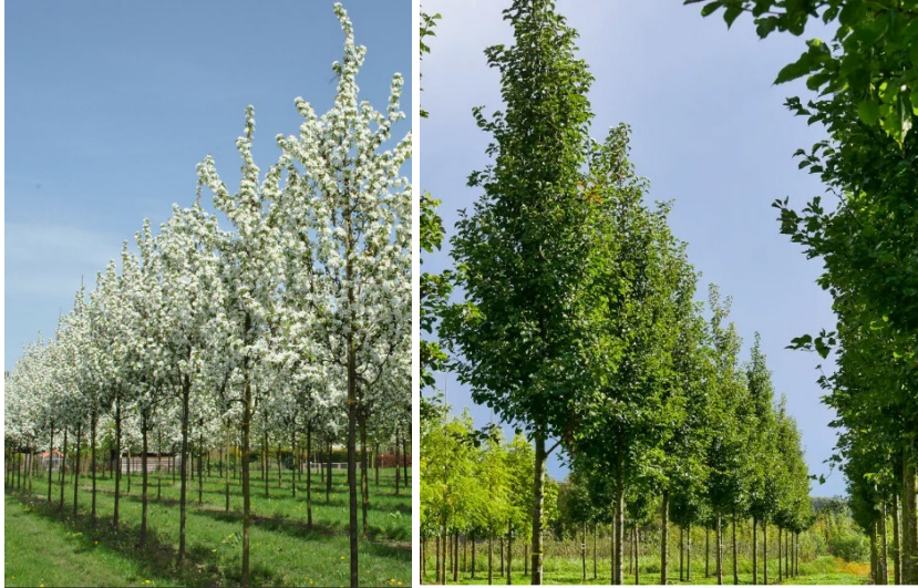
Uoginė obelis 'Street Parade'