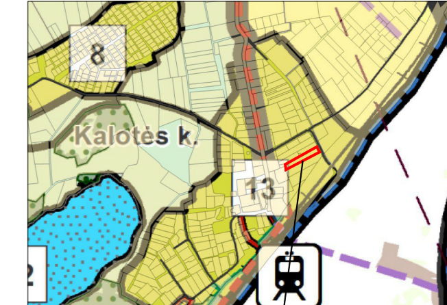
Planuojama teritorija Žemės sklypas Kalotės k., Krettingalės sen., Klaipėdos raj. (kad. Nr. 5528/0001:646).