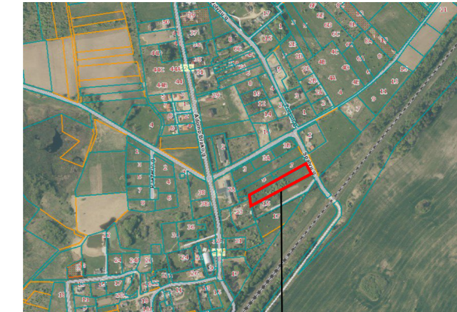
Planuojama teritorija Žemės sklypas Kalotės k., Krettingalės sen., Klaipėdos raj. (kad. Nr. 5528/0001:646).