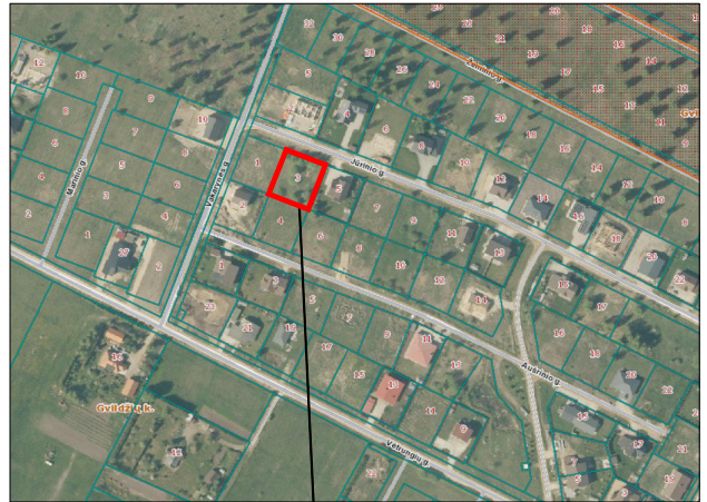
Planuojamas žemės sklypas