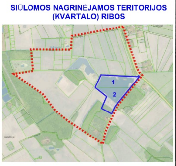
SIŪLOMOS PLANUOTI TERITORIJOS SCHEMA