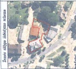
Žemės sklypo išdėstymo schema

ŽEMĖS SKLYPO PLANAS M 1:500 Sklypo plotas 998 m 2