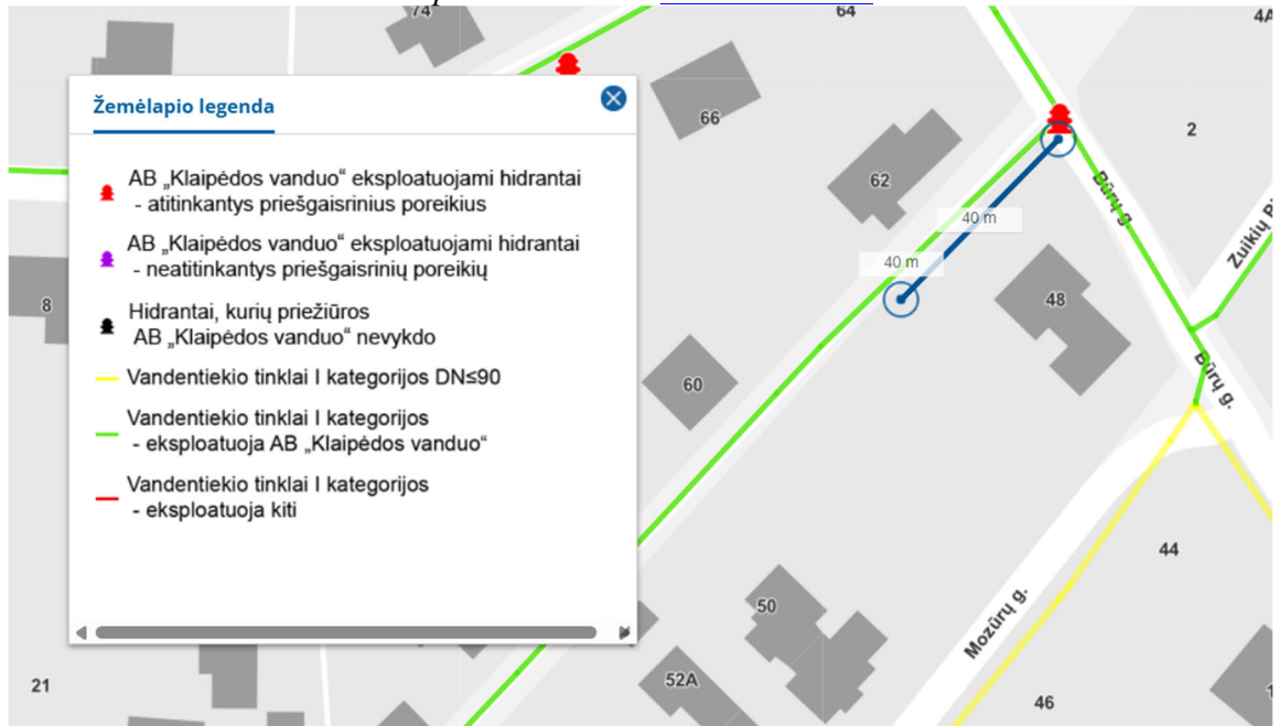
2 pav.

Artimiausia priešgaisrinė gelbėjimo tarnyba – už ~ 9 km, adresu Trilapio g. 12, Klaipėda. Vadovaujantis Gaisrinės saugos normomis teritorijų planavimo dokumentams rengti 11 p., detaliojo plano sprendiniai sudaro galimybę įgyvendinti Gaisrinės saugos pagrindiniuose reikalavimuose numatytas sąlygas gaisrų gesinimo ir gelbėjimo automobiliams privažiuoti prie kiekvieno statinio, gaisro gesinimo vandens šaltinio.