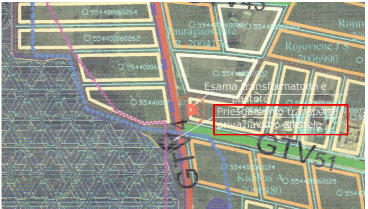
2 pav. Ištrauka iš Ketvergių gyvenvietės aplinkos susisiekimo sistemos bei inžinerinės infrastruktūros vystymo specialiojo plano, registro Nr. T00069692