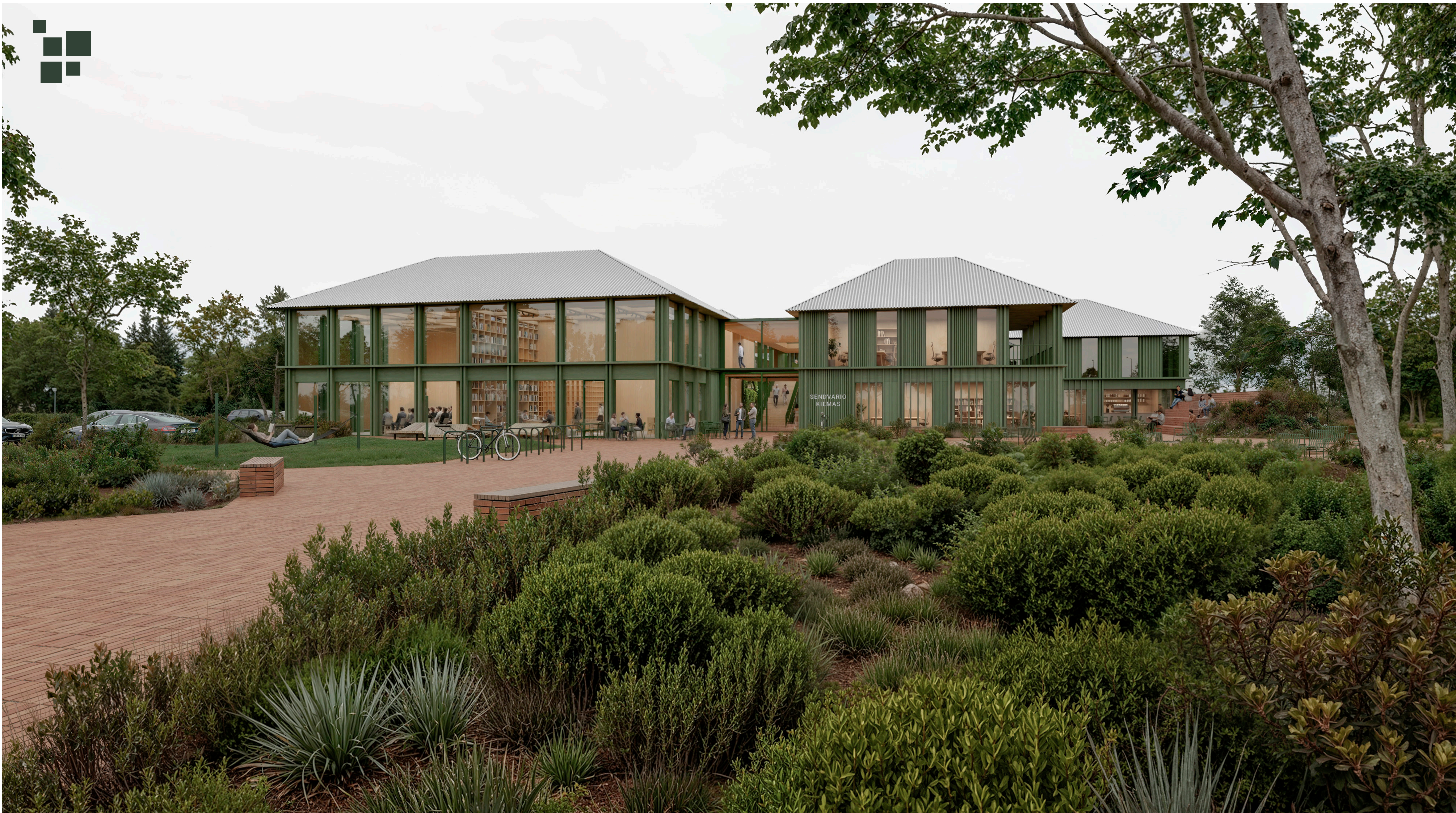
Eksterjero vaizdas Pagrindinio įėjimo vaizdas nuo Jurgaičių gatvės. Bendruomenės namai apsupti žalumais ir jaukiomis laisvalaikio praleidimo erdvėmis: žalios nišos su suoliukais, lauko stalo žaidimai, vandens elementas, hamakai, supynės, lauko kino teatras ir kiti.