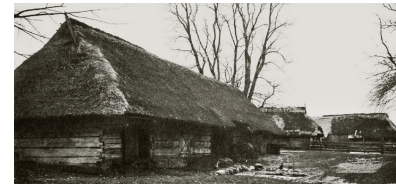
Architektūrinių formų įkvėpimas iš tradicijos Natūralios fasado medžiagos ir tipiniai keturšlaičiai stogai, kuria naują bendruomenės ir sveikatingumo centrą.