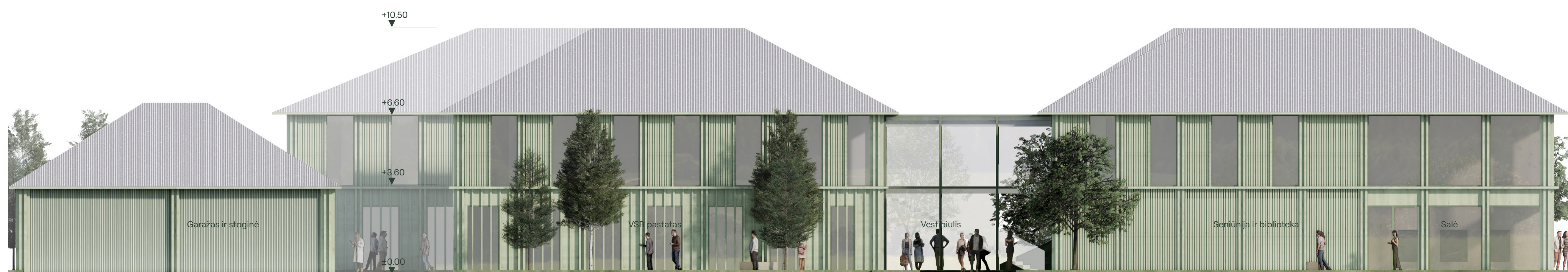
Vakarinis fasadas 1:100