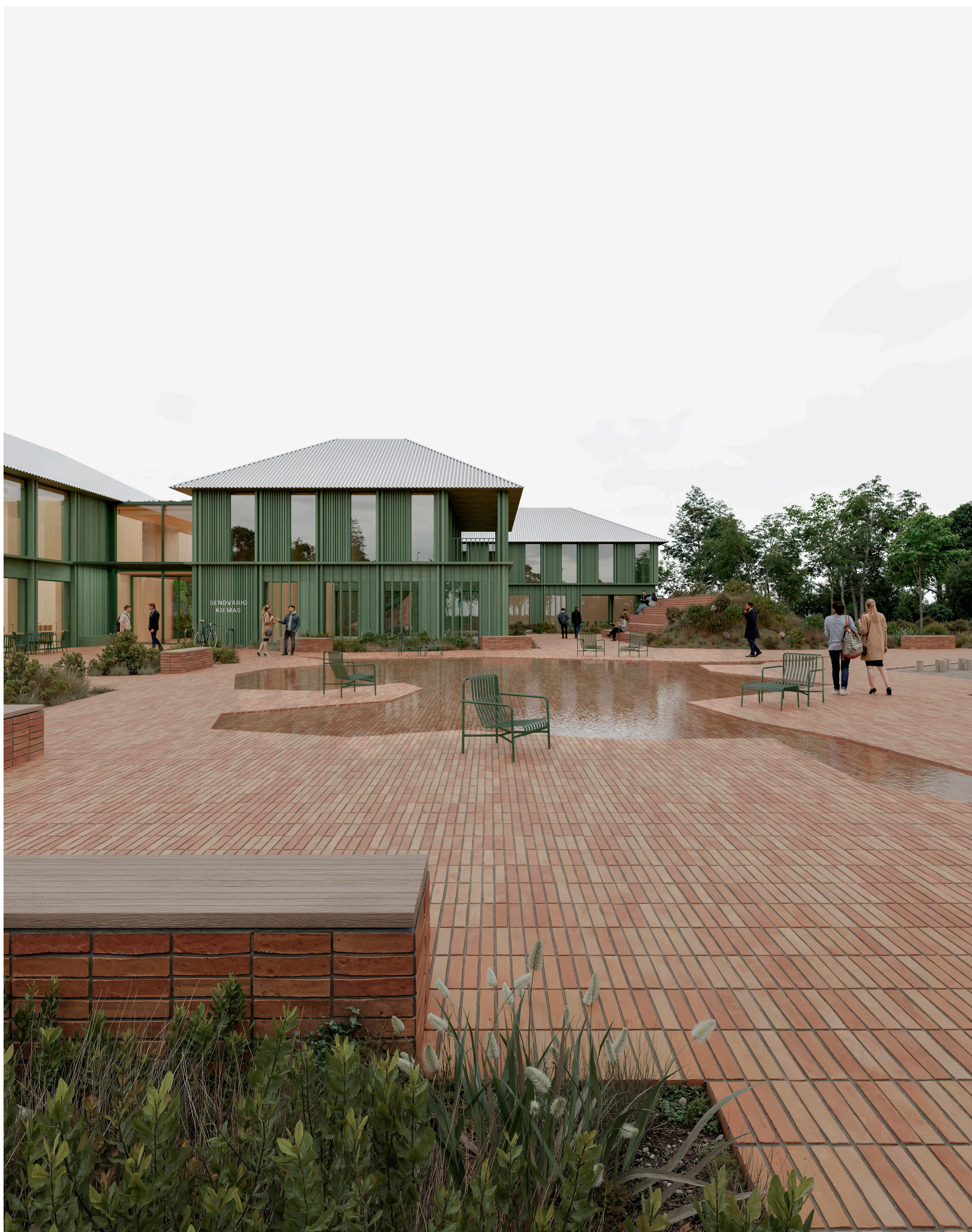
Mazosios architektūros vaizdas Suoliukai integruoti į grindinį. Vandens elementas pagrindinis akcentas žaliame kieme. Ši erdvė gali turėti kelis scenarijus. Pvz kai vanduo nudrenuojamas gali vykti įvairūs renjiniai apimantys daugiau erdvių. Vasaros metu vanduo vėsina.