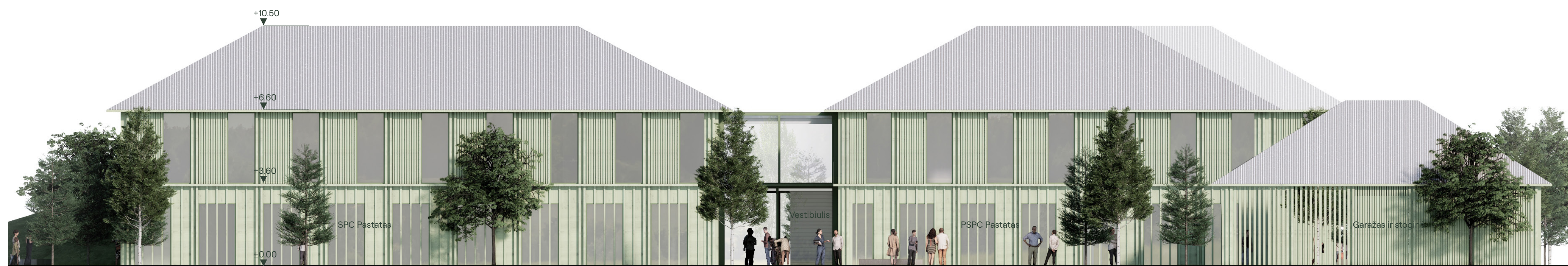
Šiaurinis fasadas 1:100