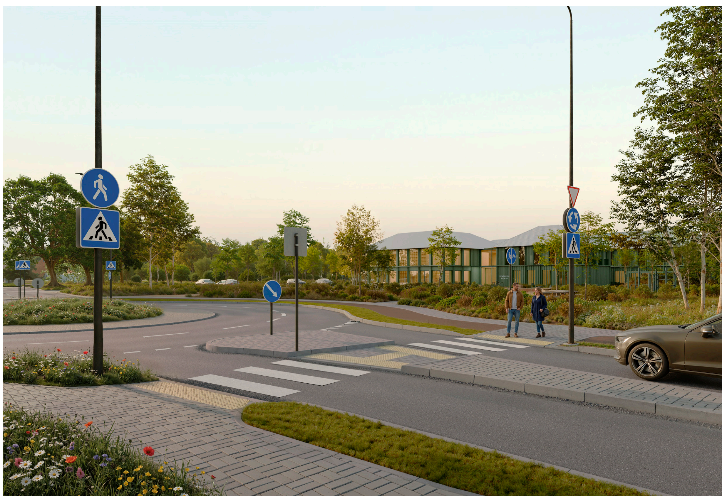
Eksterjero vaizdas Įstatomas pastatas | nuotrauką D6.