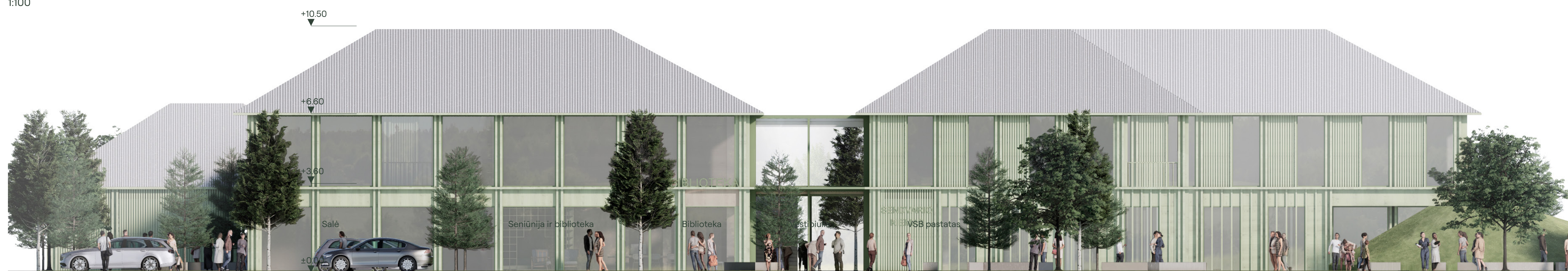
Pietinis fasadas 1:100