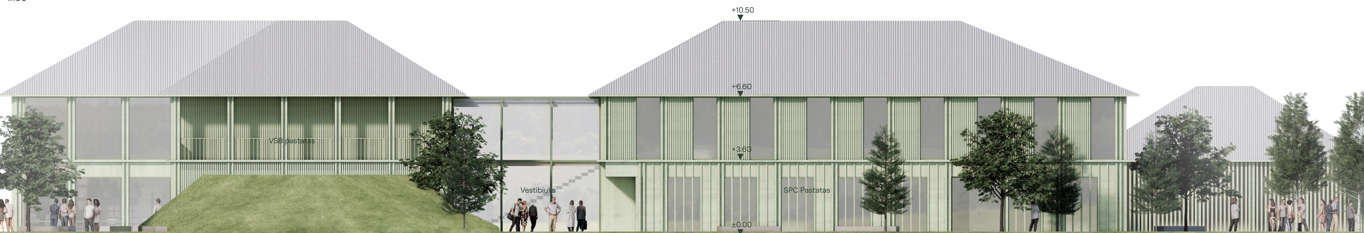
Rytinis fasadas 1:100