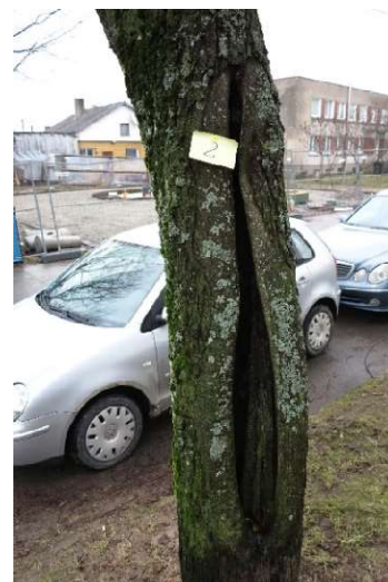
Liepa nr.2 (kamiene didelė drevė)