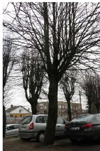
Liepa nr. 5