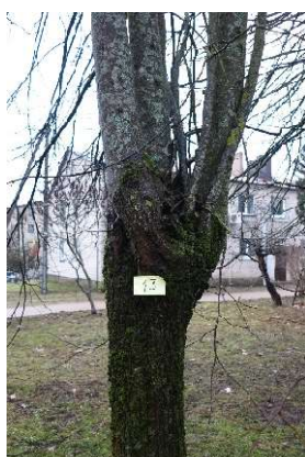
Liepos nr.13 kamienas