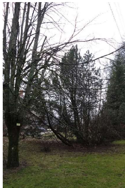
Kalninė pušis nr. 15