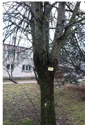
Liepa nr. 14