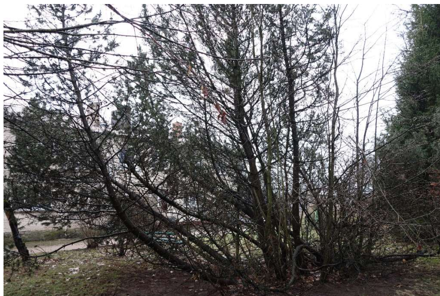
Kalninė pušis nr.15