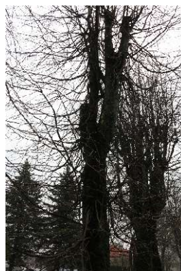
Liepa Nr. 9