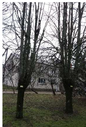
Liepos nr. 13,14