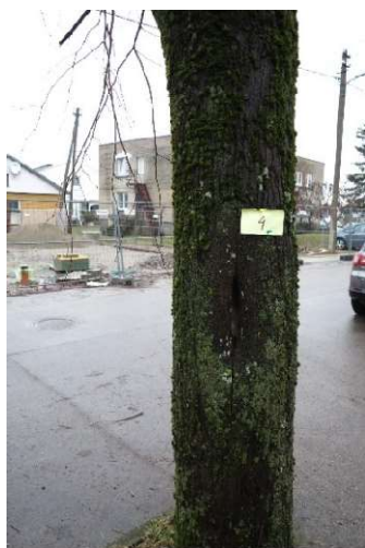
Nr. 4 (drevės kamiene)