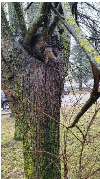
Nr. 14 kamienas