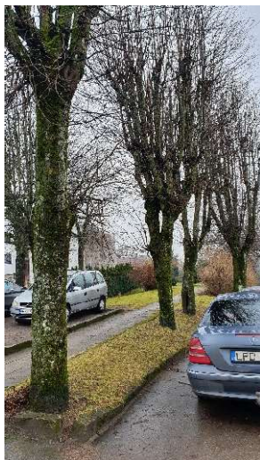
Medžių eilė nr. 4-1(nuo gatvės)