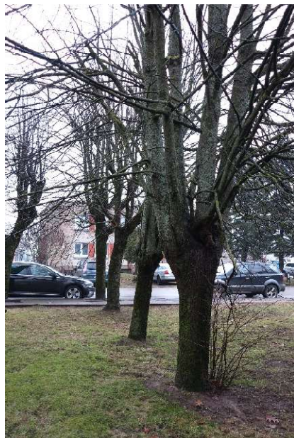
Medžių eilė nr. 14-12