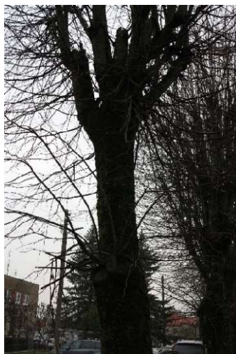
Medžio nr. 4 laja