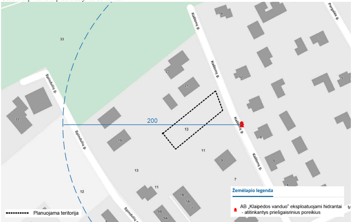
Gaisrinių hidrantų išsidėstymo schema:

Priešgaisrinių gelbėjimo pajėgų padalinių dislokacija, išdėstymas. Artimiausia gaisrinė – maždaug ~6,0 km atstumu, adresu Šilutės pl. 58, 94181 Klaipėda.